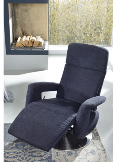
Sessel FEELS STYLE PLUS