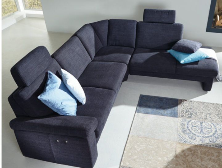
Polsterecke mit Senkrücken-Funktion und Winkecke, Kopfstützen optional.

Für jede Körpergröße der passende Sessel: FEELS STYLE PLUS ist in zehn Ergonomiegrößen preisgleich lieferbar. Drei Sitzhöhen, drei Sitztiefen und vier Fußvarianten stehen zur Wahl. Serienmäßig ist der TV Sessel mit Gasdruckfeder ausgestattet. Fußstütze und Rückenlehne sind stufenlos bis zur Liegeposition verstellbar.